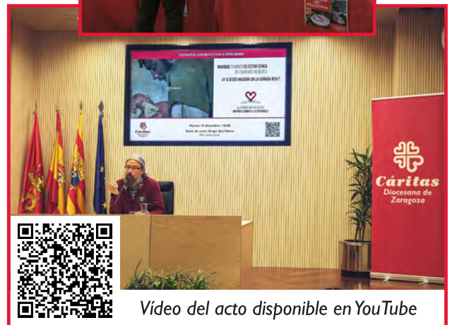
Vídeo del acto disponible en YouTube